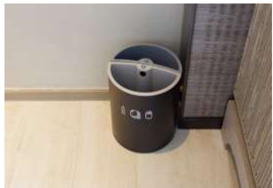
ภาพที่ 2.2-22 ถังขยะภายในโครงการ