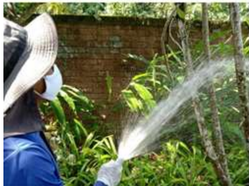
ภาพที่ 2.2-11 ก๊อกน้ำรดน้ำต้นไม้และคนสวนสวมถุงมือทุกครั้ง