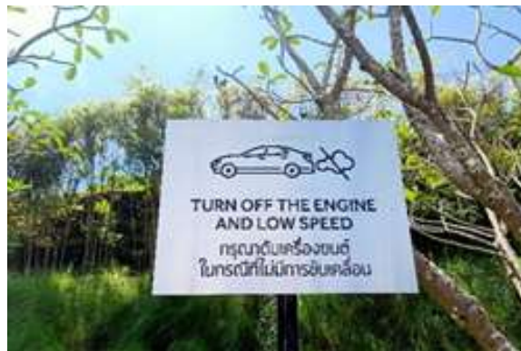
ภาพที่ 2.2-35 ป้ายจอดรถกรุณาดับเครื่องยนต์