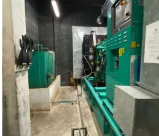
ภาพที่ 2.2-25 ระบบไฟฟ้า และการรณรงค์ประหยัดพลังงานของโครงการ