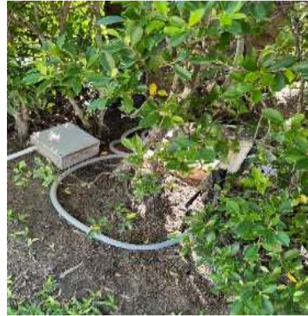
ภาพที่ 2.2-10 ระบบบำบัดน้ำเสียและการนำน้ำที่ผ่านการบำบัดแล้วมารดน้ำต้นไม้