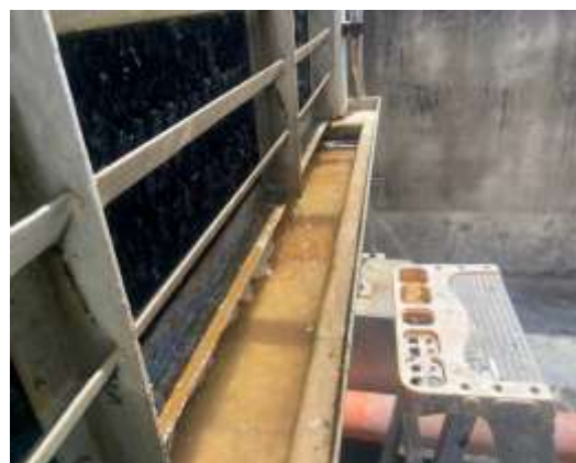
ภาพที่ 2.2-28 หอฝึ่งเย็น