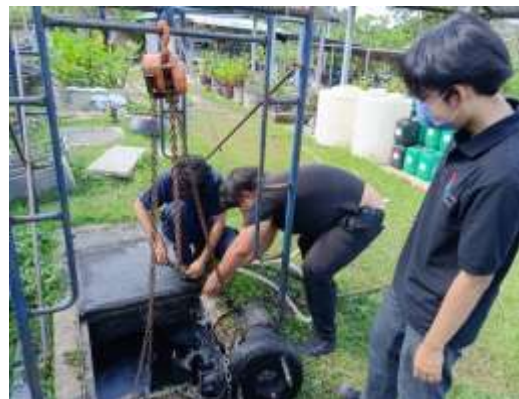
ภาพที่ 2.2-21 เจ้าหน้าที่ตรวจสอบระบบบำบัดน้ำเสีย