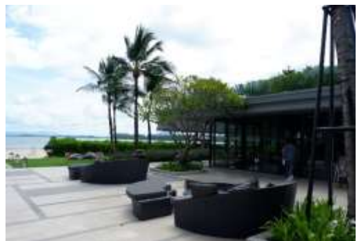
ภาพที่ 2.2-32 พื้นที่พักผ่อนภายในโครงการ