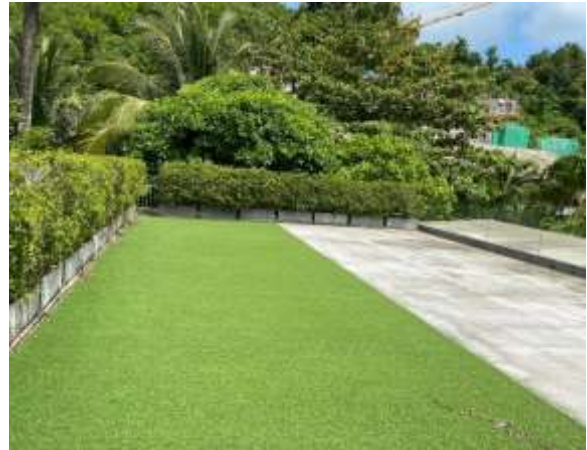
ภาพที่ 2.2-1 พื้นที่หญัาบริเวณชั้นหลังคาของ H3 และอาคาร H4