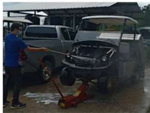
ภาพที่ 2.2-20 การนำน้ำที่ผ่านการรีไซเคิลมาใช้ประโยชน์