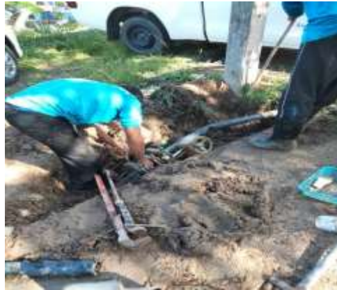
ภาพที่ 2.2-19 เจ้าหน้าที่ตรวจสอบวางระบายน้ำภายในโครงการ