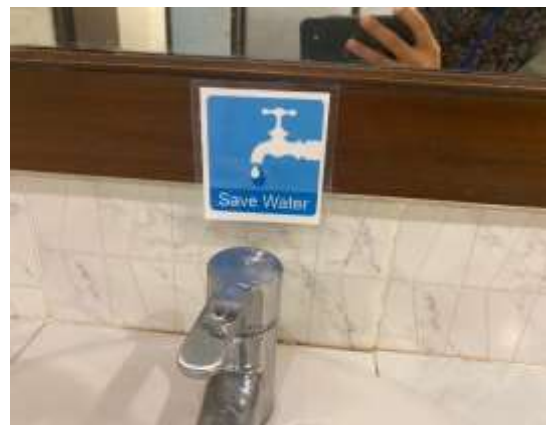
ภาพที่ 2.2-17 สุขภัณฑ์ประหยัดน้ำ