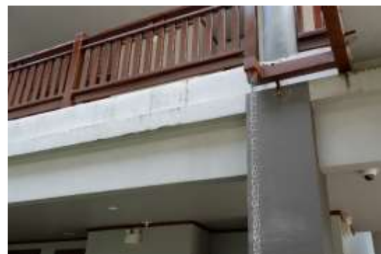
ภาพที่ 2.2-33 ระเบียงห้องพักที่มีความแข็งแรง