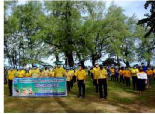
ภาพที่ 2.2-34 โครงการมีส่วนร่วมกับชุมชนโดยรอบ