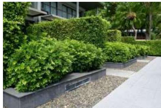
ภาพที่ 2.2-7 พื้นที่สีเขียว