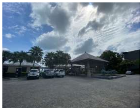
ภาพที่ 2.2-13 ที่จอดรถภายในโครงการ (ต่อ)