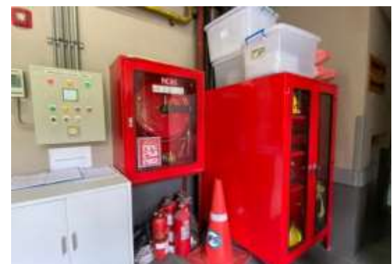
ภาพที่ 2.2-26 (ต่อ) ระบบป้องกันและแจ้งเตือนอัคคีภัย