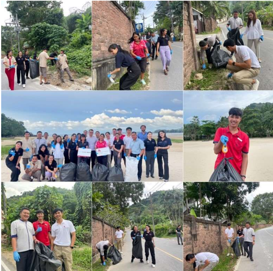
ภาพที่ 2.2-9 พนักงานทำความสะอาดในบริเวณหน้าพื้นที่โครงการ