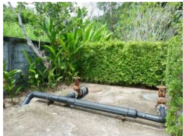
ภาพที่ 2.2-18 บ่อหน่วงน้ำ และปั๊มสูบน้ำของโครงการ