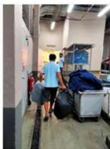
ภาพที่ 2.2-24 การจัดการขยะภายในโครงการ