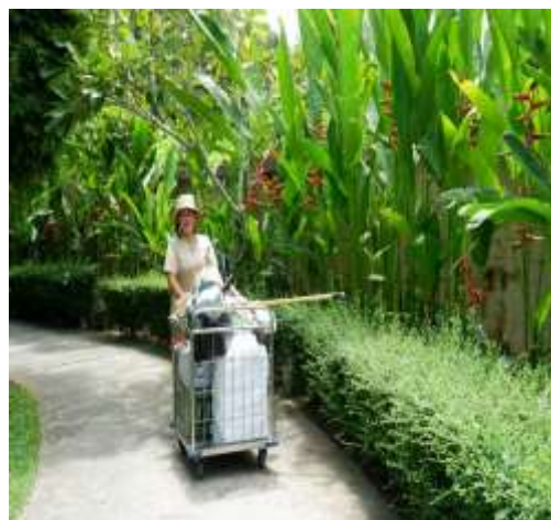
ภาพที่ 2-2-8 เจ้าหน้าที่ทำความสะอาดถนนภายในโครงการ