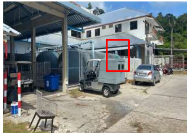
ภาพที่ 2.2-2 จุดรวมพลกรณีเกิดแผ่นดินไหว การเกิดสึนามิ และไฟไหม้