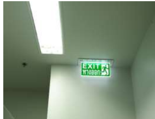
ภาพที่ 2.2-3 ผังเส้นทางหนีภัยภายในอาคารและป้ายบอกเส้นทางไปยังจุดรวมพล