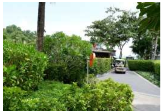
ภาพที่ 2.2-14 เส้นทางคมนาคมภายในโครงการ