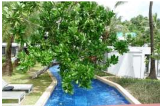
ภาพที่ 2.2-29 สระว่ายน้ำโครงการ