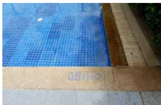
ภาพที่ 2.2-29 สระว่ายน้ำโครงการ (ต่อ)