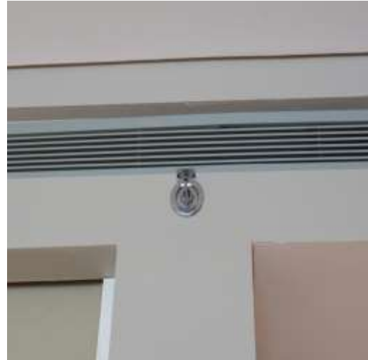
ภาพที่ 2.2-26 ระบบป้องกันและแจ้งเตือนอัคคีภัย