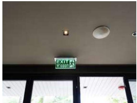
ภาพที่ 2.2-26 (ต่อ) ระบบป้องกันและแจ้งเตือนอัคคีภัย