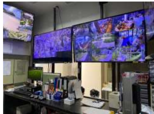
ภาพที่ 2.2-4 ห้องควบคุมติดตามข่าวสาร พร้อมอุปกรณ์ช่วยเหลือฉุกเฉินเบื้องต้น และวิทยุขอความช่วยเหลือ