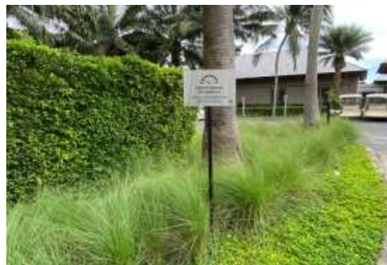
ภาพที่ 2.2-36 ป้ายจำกัดความเร็ว