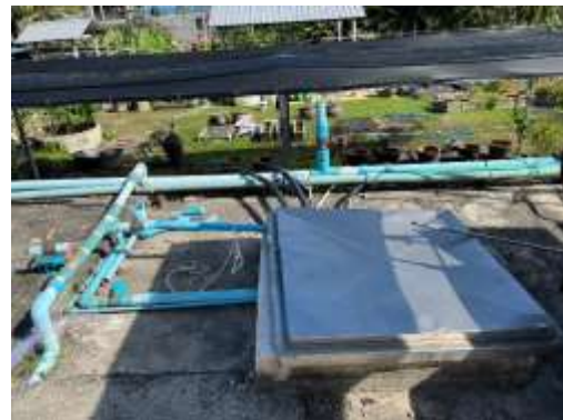
ภาพที่ 2.2-15 ถึงเก็บน้ำสำรองของโครงการ