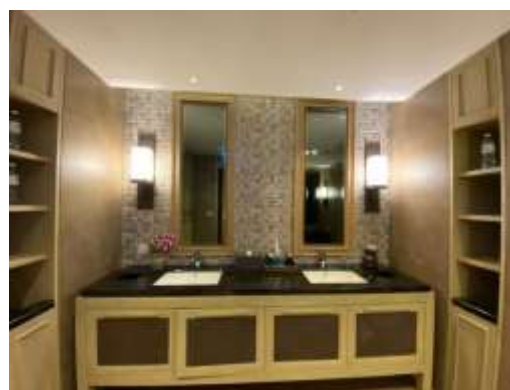
ภาพที่ 2.2-30 สปายภายในโครงการ