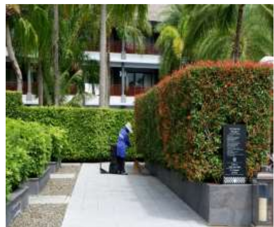
ภาพที่ 2.2-6 เจ้าหน้าที่ดูแลพื้นที่สีเขียว