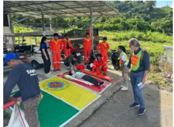
ภาพที่ 2.2-5 ซ่อมดับเพลิงและอพยพหนีไฟ ประจำปี 2566 (ปี 2567 ยังไม่มีการซ้อมดับเพลิง)