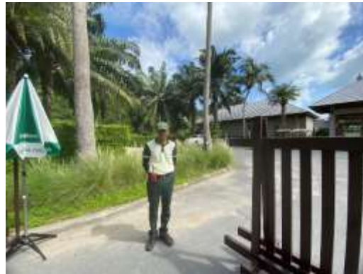
ภาพที่ 2.2-27 เจ้าหน้าที่รักษาความปลอดภัยภายในโครงการตลอด 24 ชั่วโมง