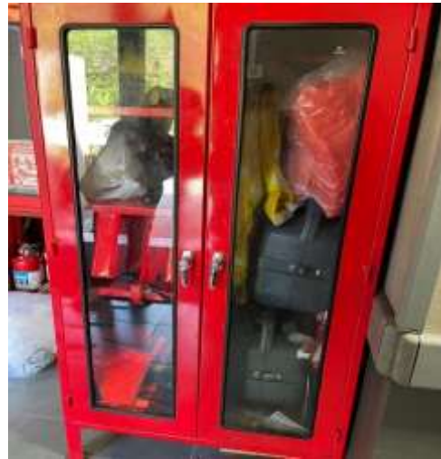
ภาพที่ 2.2-4 ห้องควบคุมติดตามข่าวสาร พร้อมอุปกรณ์ช่วยเหลือฉุกเฉินเบื้องต้น และวิทยุขอความช่วยเหลือ (ต่อ)