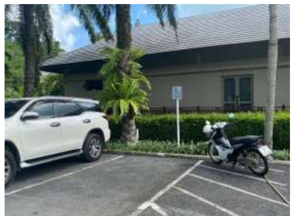
ภาพที่ 2.2-13 ที่จอดรถภายในโครงการ