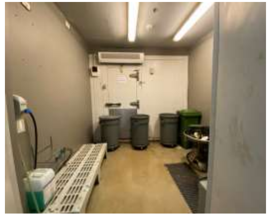
ภาพที่ 2.2-23 ห้องพัสดุรวมของโครงการ