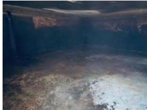
ภาพที่ 2.2-16 เจ้าหน้าที่ทำความสะอาดถึงเก็บน้ำใช้