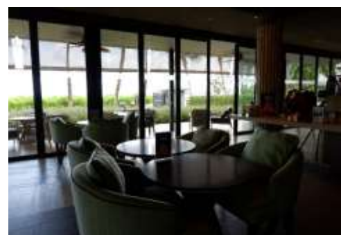
ภาพที่ 2.2-31 การจัดการร้านอาหารของโครงการในปัจจุบัน