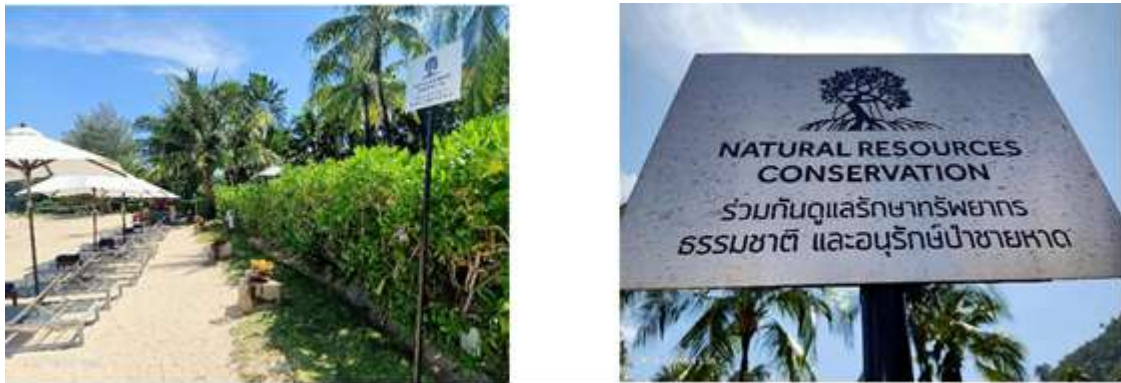
ภาพที่ 2.2-37 ป้ายช่วยกันดูแลรักษาทรัพยากรธรรมชาติและอนุรักษ์ป่าชายหาด